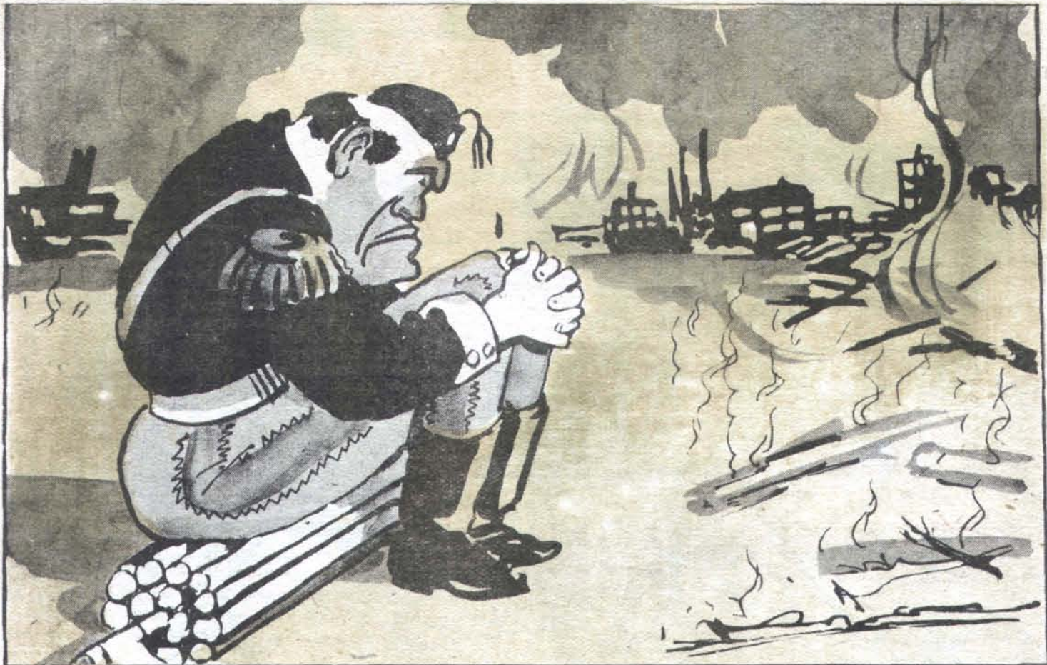
Ты сидишь одиноко и смотришь с тоской, как печально Турин догорает...