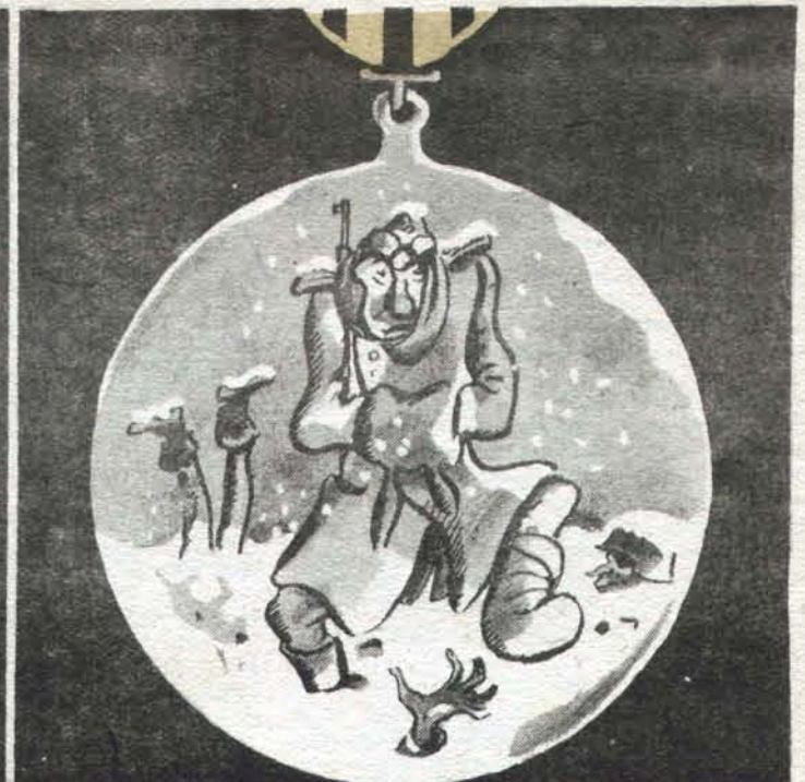
ее обратная сторона.