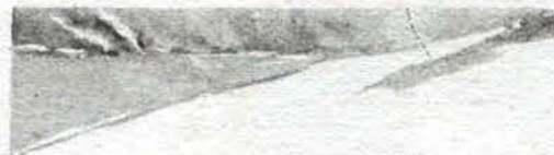
Рис. И. Семенова