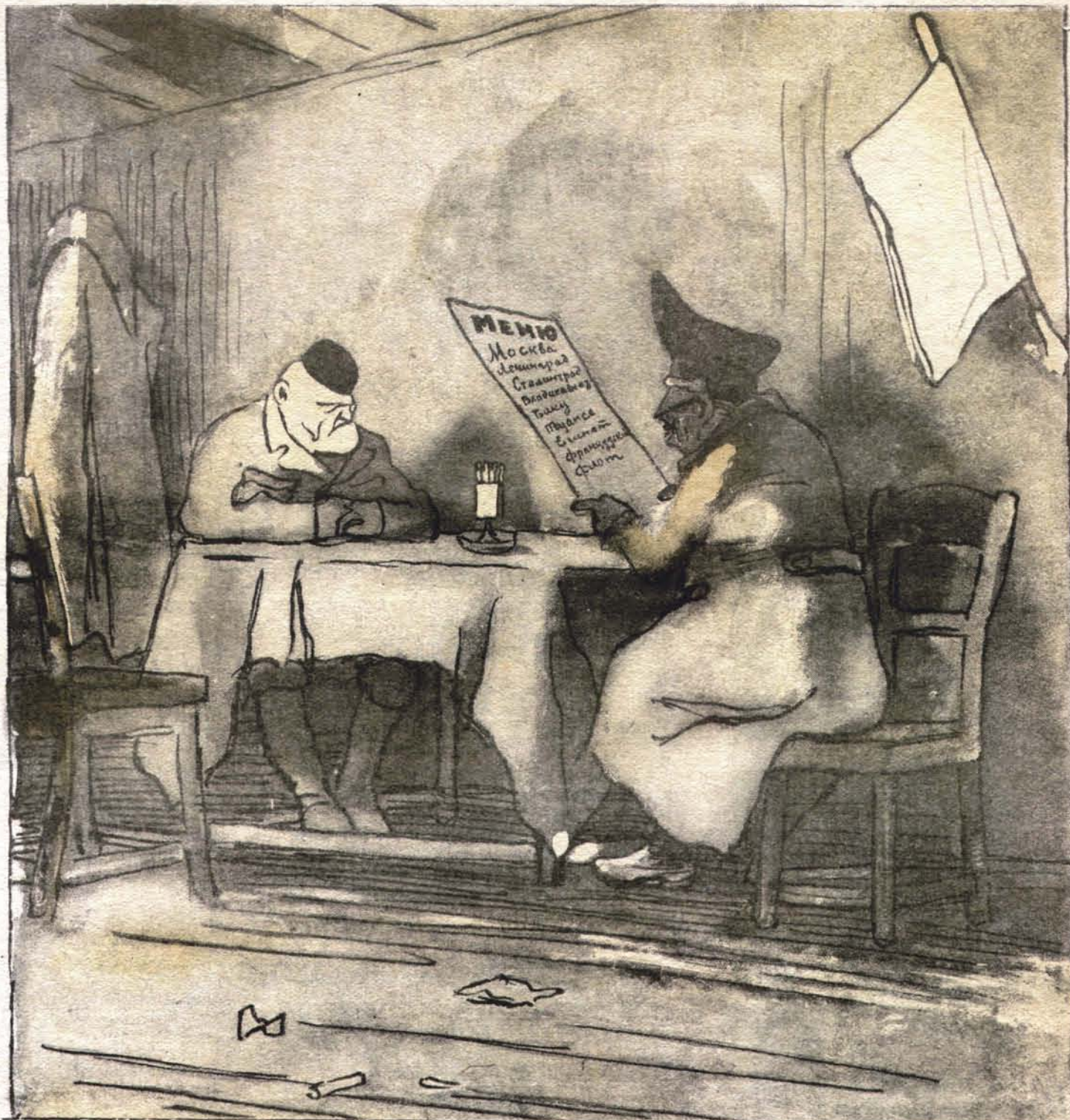
— Ох, боюсь, что мой друг Адольф, ничего не получив по этому меню, захочет закусить Италией!