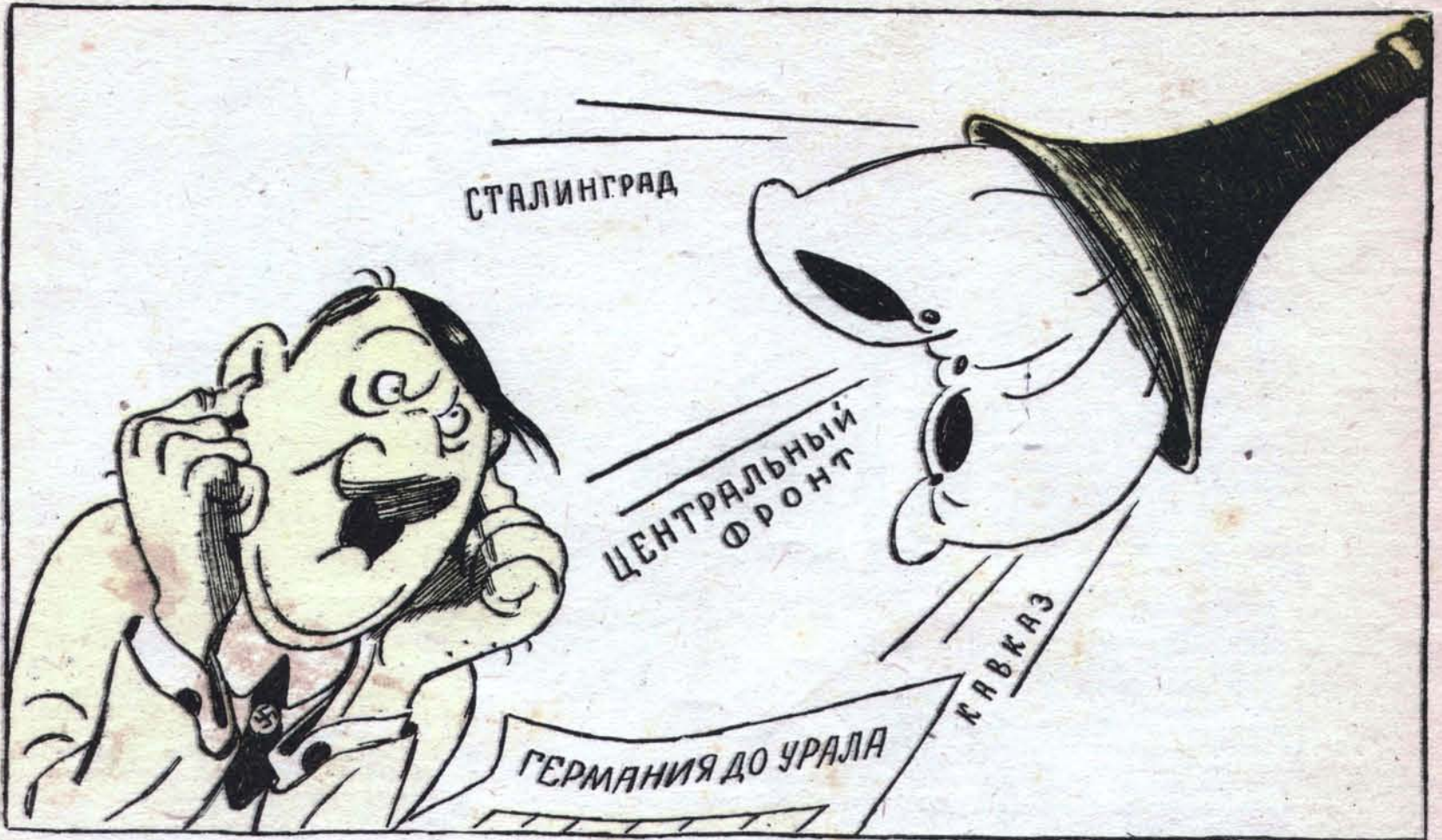
Немцам никогда не дойти до Урала...